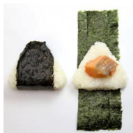
しっとり海苔・三角形