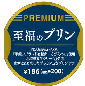
商品パッケージ例

スリーエフのオリジナルブランド「F STYLE（エフスタイル）」のスイーツは、人気の“もちぼにょ”を筆頭に現在17種類のラインナップを揃え販売しています。今回、発売する2品はいずれも素材・製法にこだわり、自信をもって“プレミアム”と呼べるスイーツです。プリン、杏仁豆腐と非常にシンプルなスイーツですが、だからこそ素材の美味しさをひとくち目から感じていただける味わいに仕上げました。まさに“至福”のひとときを堪能できる商品です。パッケージにはわかりやすく“プレミアム”マークを入れ、素材や製法へのこだわりを訴求しました。スリーエフでは今後も継続的に素材・製法にこだわった“プレミアム”スイーツを販売してまいります。